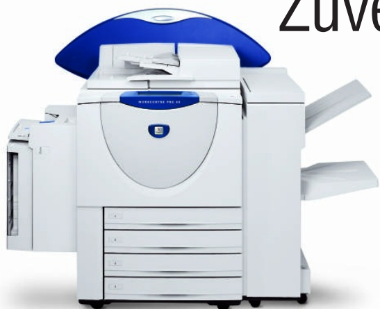
WorkCentre Pro 65 mit optionalem Großraum-Papierbehälter für 3.100 Blatt und Office Finisher

Neuvorstellung der Xerox WorkCentre® Pro 65/75/90 Advanced Multifunktions-Systeme. Eine ganze Familie leistungsstarker Systeme, mit denen Sie mehr Arbeit besser erledigen können.